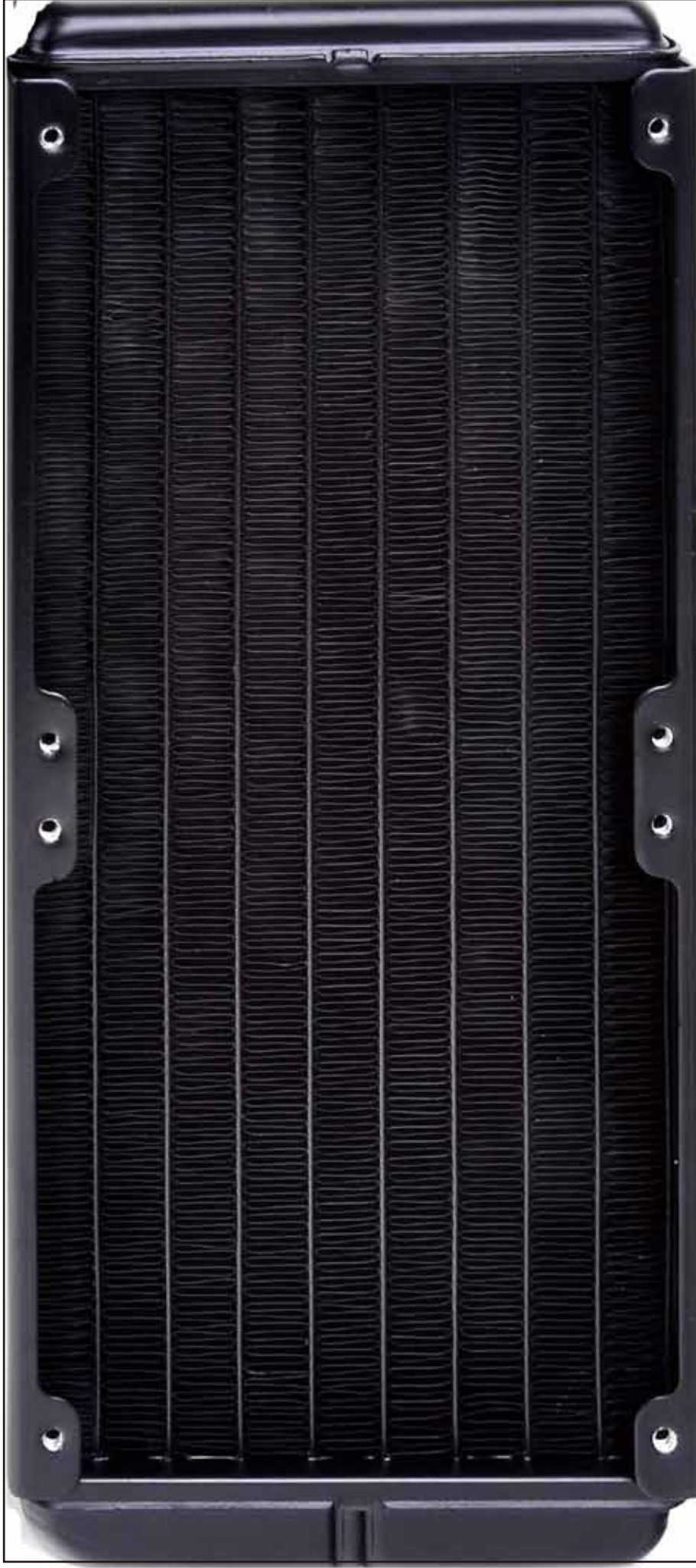
CLW0217 Water2.0 Extreme ラジエタ寸 確認用 BOX (2 枚要)